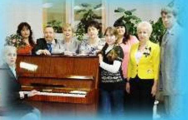
Городской поэтический клуб «Вдохновение»