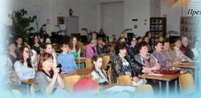
День рождения клуба «Вдохновение». Благодарные читатели