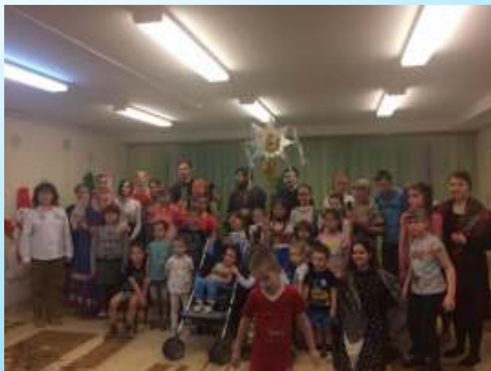
Поздравление с Рождеством Христовым детей-инвалидов в БУ "ЦЕНТР СОЦИАЛЬНОЙ ПОМОЩИ СЕМЬЕ И ДЕТЯМ "РАДУГА НАДЕЖДЫ".