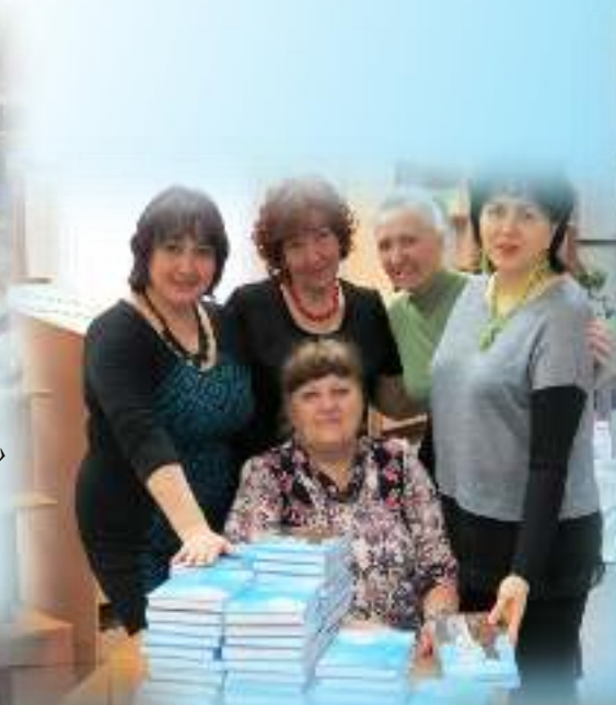
Презентация поэтического сборника «Созвучье строк» (2013 год)