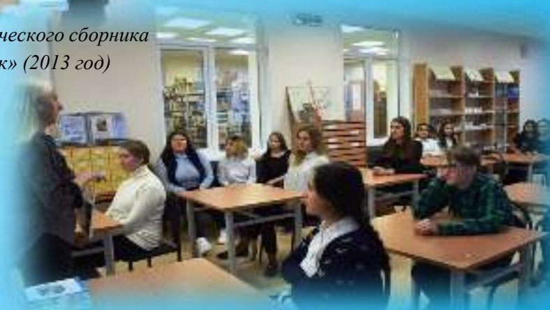
Творческая встреча в Когалымском политехническом колледже