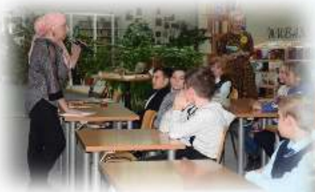
Творческая встреча клуба «Вдохновение» с молодёжью