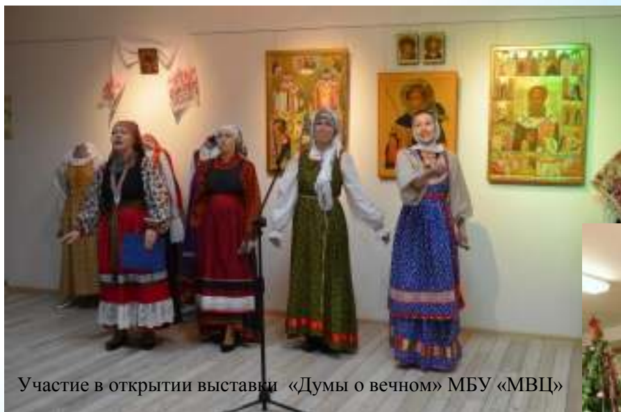
Участие в открытии выставки «Думы о вечном» МБУ «МВЦ»