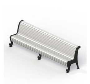
Диван садово-парковый на чугунных ножках