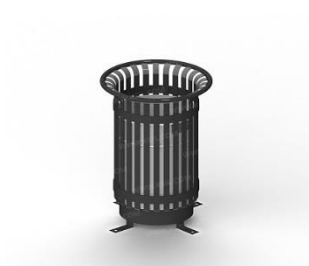
Урна металлическая с окрашенной вставкой