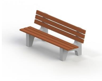
Диван садово-парковый на железобетонных ножках