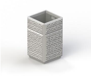
Урна железобетонная с металлической вставкой