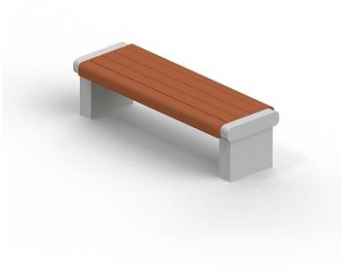
Скамья садово-парковая на железобетонных ножках