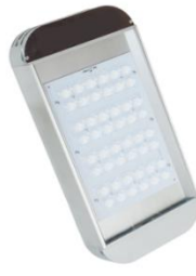
Светильник уличный светодиодный