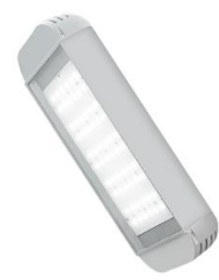
Светильник уличный светодиодный